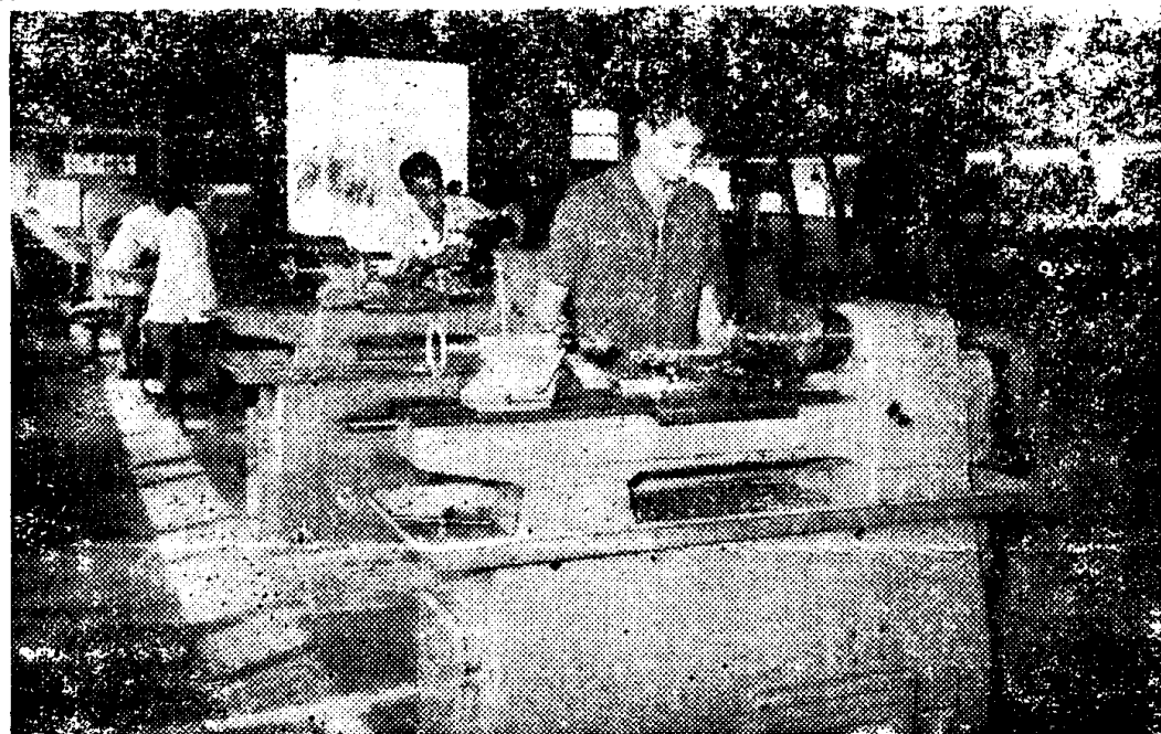
Voor de opleiding van de leerlingen beschikt de LTS over moderne kostbare machines.

Reeds in 1952 kenden Turkse officieren terug uit de Verenigde Staten, vol met ideeën en vervuld van denkbeelden over de noodzakelijk geachte reorganisatie van de Turkse strijdkrachten. Maar lang moesten deze jongeren nog tegen een stenen muur oplopen. De ouderen hielden nog vast aan de traditie. Hun kansen kregen en grepen de jongeren, toen ook de studenten (die maar weinig kansen kregen om hun bekwaamheden te gebruiken) in verzet kwamen. In Washington geloofden de deskundigen dat het Turkse militaire systeem beter zal worden. Welk regime er zal komen is nog niet te voorspellen. Turkije kent nog steeds het conflict tussen zijn verleden van Oosters despotisme en de Westerse opvattingen waarheen men wil. Het is echter niet waarschijnlijk, dat de banden met het Westen en de Verenigde Staten verbroken zullen worden.